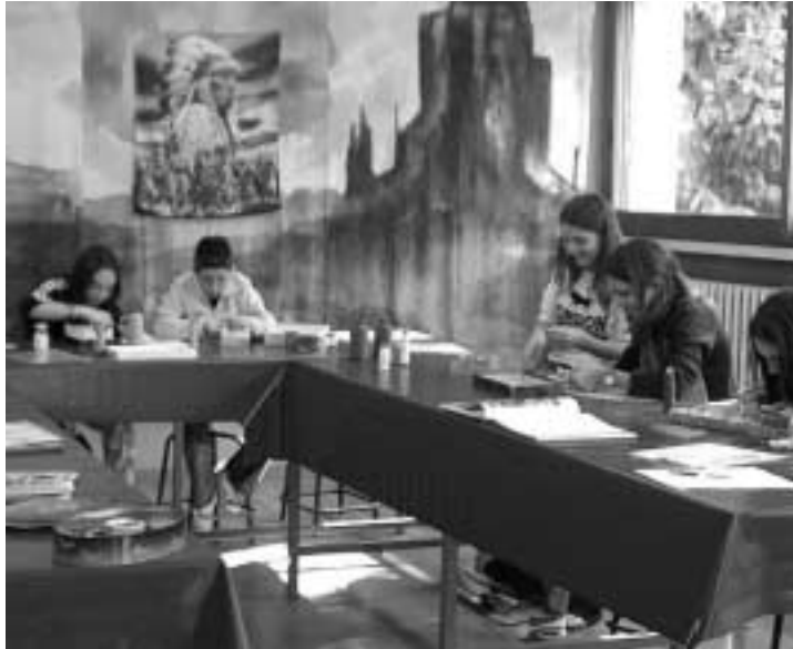
Laboratorio in piena attività - Cornate d'Adda

Da segnalare anche che gli alunni del laboratorio musicale hanno partecipa-