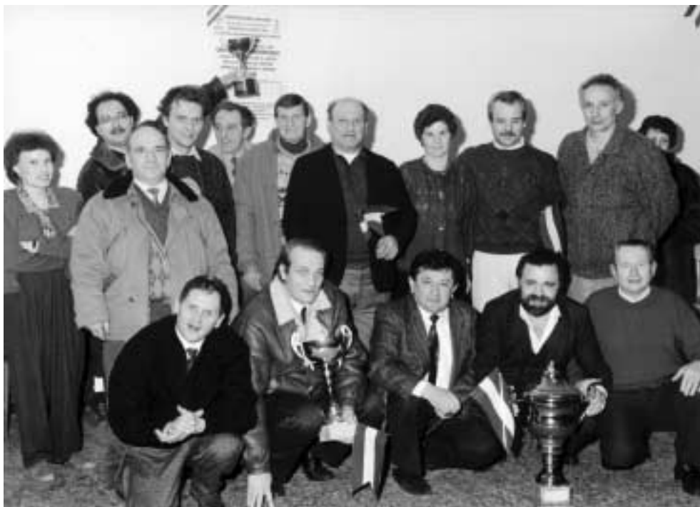
Alcuni membri della "Cartofila dell'Ancora" in una foto d'epoca - Cornate d'Adda

Gioco sì, ma anche sana e leale competizione!