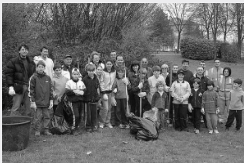
I Protagonisti dell'iniziativa "verde pulito" - Cascina Fugazza

bimbi ci osservano e ci imitano! Per questo al prossimo appuntamento vi aspettiamo sempre più numerosi.