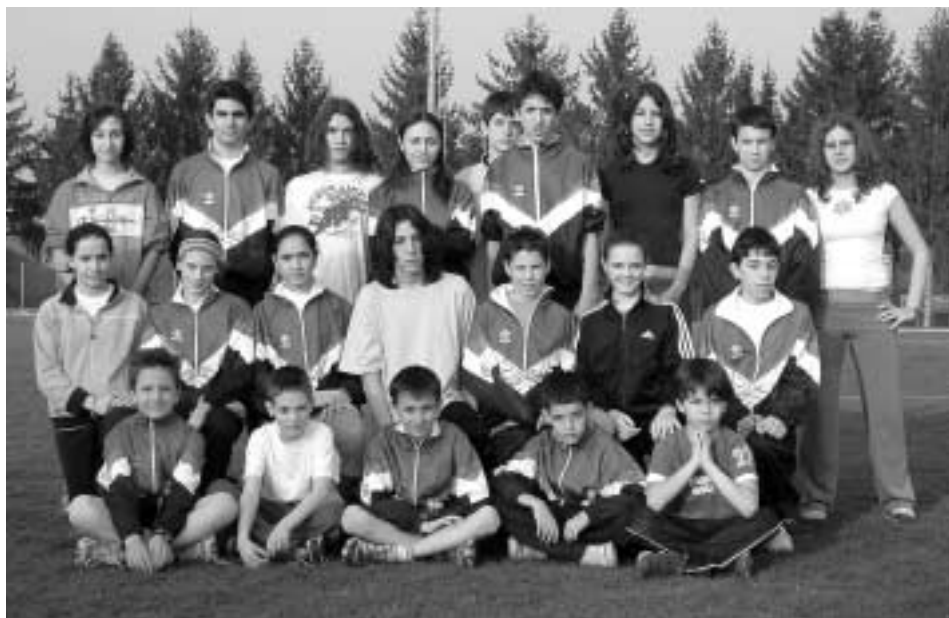
Foto di gruppo per i ragazzi dell'Atletica Club - Cornate d'Adda

Ad esempio, il prossimo 2 maggio , presso il nostro Centro Sportivo Comunale, scenderanno in pista gli at-