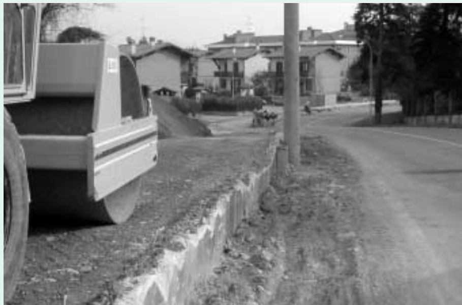
Lavori in corso per la pista ciclopedonale Cornate-Porto d'Adda

9. Sono state ultimate le sistemazioni delle aree a verde dei parcheggi del centro sportivo, della via Dossi e del cimitero dei caduti di via Matteotti.